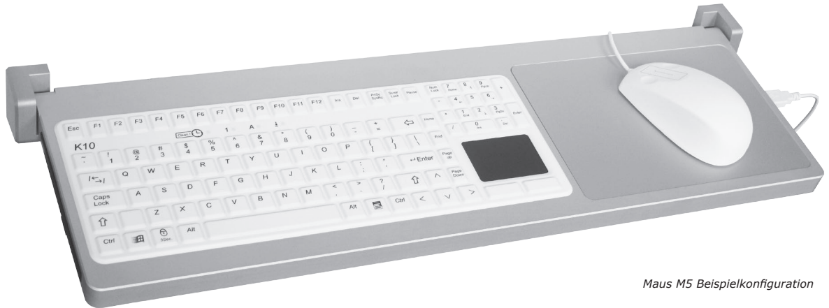
Maus M5 Beispielkonfiguration